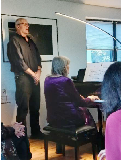
„Herr Schmidt singt. Frau Schmidt am Klavier“